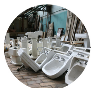
Sanitair - Sanitaire - Sanitary Hergebruik - Réemploi - Reuse RotorDC