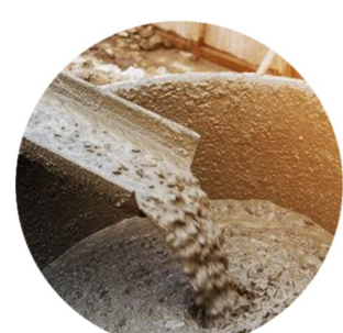
Beton - Béton - Concrete Nieuw - Neuf - New