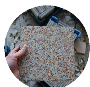
Vloertegels - Carrelage - Tiles Isolatie - Isolation thermique - Insulation Hergebruik - Réemploi - Reuse RotorDC Gebruiktematerialen.com