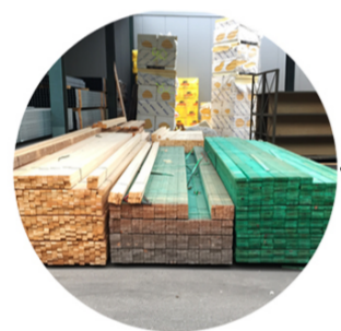
Dakstructuur - Structure de toit - Roof structure Isolatie - Isolation thermique - Insulation Overstock - Fin de stock - Unused Bouwstocks