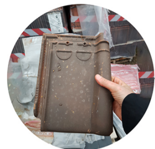
Dakpannen - Tuiles - Roof tiles Werkoverschot - Fin de stock - Unused Bouwstock

EN | The small building next to the visitor's pavilion houses the new toilets for the local youth movement and the visitors of the festival Breugel's Eye . The building was put up with materials sourced in three different ways: reused materials (salvaged from buildings slated for demolition), unused materials from other construction sites, and new materials. Less than a third (in % kg) of the materials used here are new. In the current building industry, reused and unused materials and components are only seldom used for new construction or renovation projects; both are usually reduced into as good as worthless rubble. This modest construction project wants to demonstrate things can be done differently.