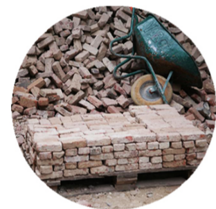
Bakstenen - Briques - Bricks Hergebruik - Réemploi - Reuse Franck