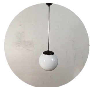
Armaturen - Luminaires - Light fixtures Hergebruik - Réemploi - Reuse RotorDC