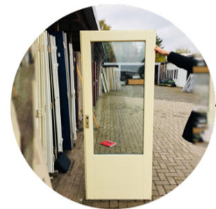
Deur - Porte - Door Raam - Fenêtre - Window Linteel - Linteau - Lintel Hergebruik - Réemploi - Reuse Gebruiktematerialen.com Croisade Pauvreté