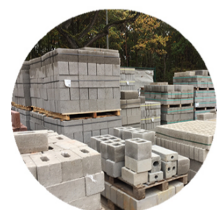
Betonblokken - Blocs en béton - Concrete blocks Isolatie - Isolation thermique - Insulation Werkoverschot - Fin de stock - Unused Bouwstocks